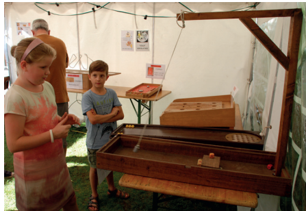
© Guido Van Ghelder - Scilla