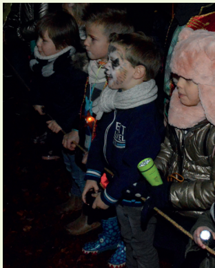
Sprookjeswandelingen © Guido Van Ghelder - Scilla

De jaarlijkse heemfeesten van Scilla tijdens het laatste weekend van augustus trekken ook heel wat bezoekers. Deze feesten zijn in 1980 ontstaan en passen binnen de traditie van de zogenaamde nieuwe buurtfeesten. Een combinatie van een hapje en een drankje, diverse optredens, een springkasteel voor de kinderen en een kampioenschap volksspelen, maakt dit evenement zeer aantrekkelijk voor jong en oud.