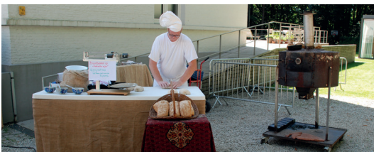
© Guido Van Ghelder – Scilla